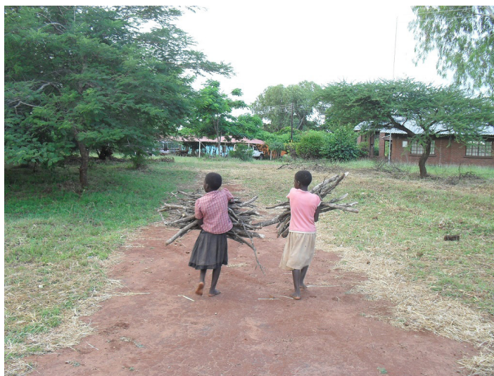
Helpen bij het oogsten van de mais (boven) & Hout sprokkelen in m'n tuin (onder)

Er werd ook gesproken over de oogst door de leerkrachten van school, bij het bekend maken van de resultaten van de toetsen, die de leerlingen aan het eind van deze periode hadden gemaakt. Op de laatste vrijdagmorgen voor de paasvakantie verzamelden alle leerlingen zich in de schaduw onder de bomen en daar werd bekend gemaakt wie geslaagd waren voor de toetsen. Wie mais plant, oogst geen pompoenen.. en wie bonen plant, oogst geen tomaten. Dus wie z'n best doet op school, haalt ook voldoende voor z'n toetsen, aldus de leerkrachten. Natuurlijk is een goede inzet belangrijk, maar net zoals de mais regen nodig heeft om te groeien en te rijpen, hebben kinderen persoonlijke zorg en begeleiding nodig om hun talenten te ontwikkelen. En dat blijft wel een aandachtspunt.